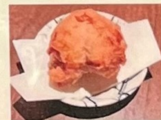
ミニサータアンダギー